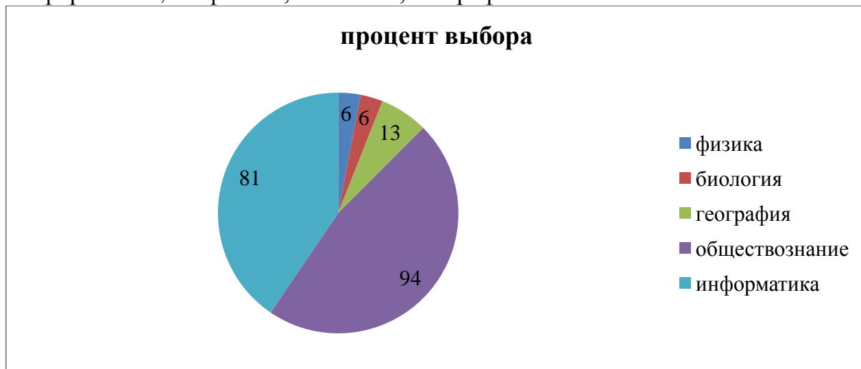
Успешность сдачи ОГЭ по предметам в сравнении с районными показателями

По-прежнему в сравнении с прошлым годом остается высоким процент выбора экзаменов по обществознанию. В этом году высокий процент выбора по информатике; по физике, биологии, географии – незначительный.